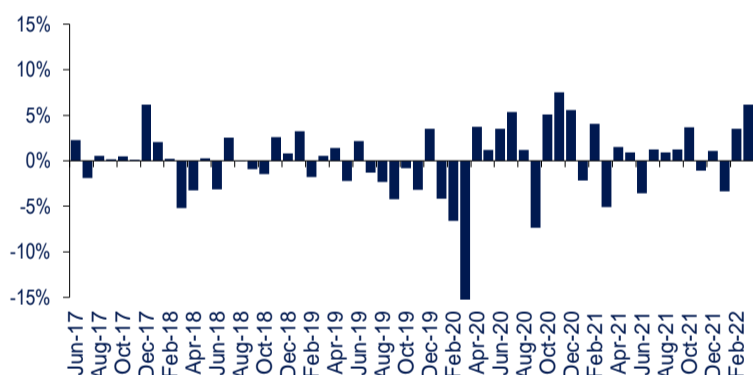
Kinerja Bulanan Schroder 90 Plus Equity Fund