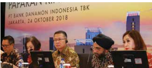
Penyelesaian Pembelian 40.0% Saham Bank Danamon oleh MUFG Bank