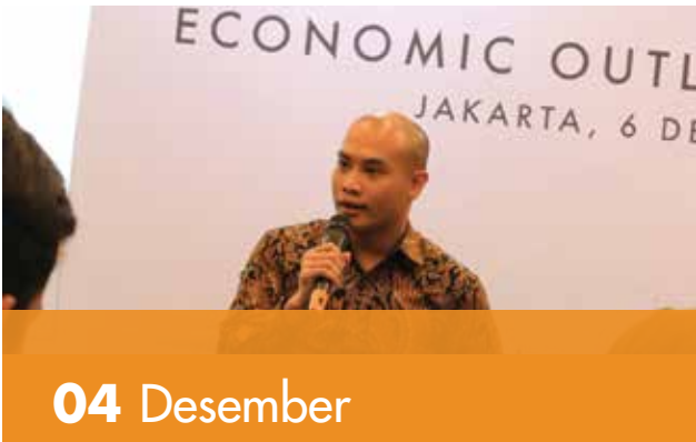
Paparan Ekonomi 2019 dengan Media