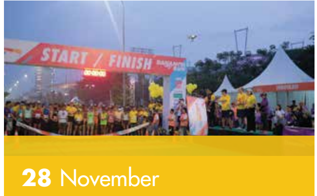
5.000 Pelari Tentukan "Finishmu Pilihanmu" di Danamon Run 2018