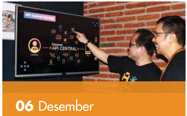
Dukung Perkembangan Era Digital, Danamon Luncurkan Layanan API Central