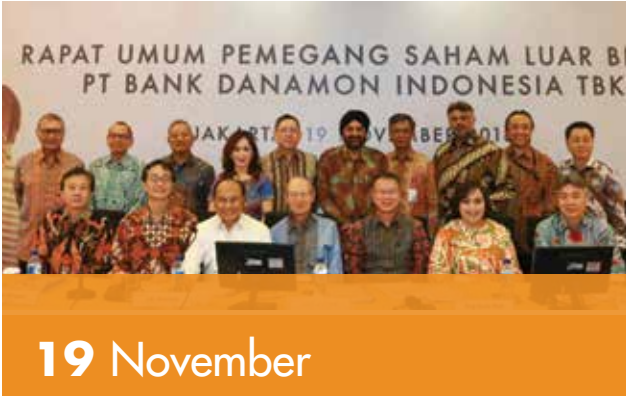
Bank Danamon Selenggarakan Rapat Umum Pemegang Saham Luar Biasa (RUPS-LB)